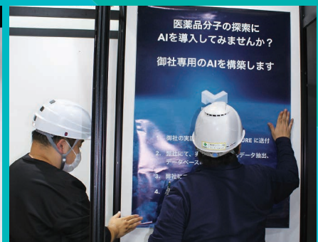
ポスター掲示等サポート