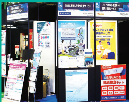
自社で工夫を凝らした展示台