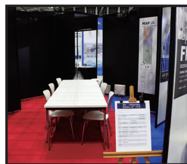
パビリオン内商談ルーム