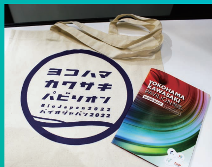
ノベルティとパンフレット